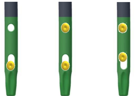
Bloqueo Dinámico Bloqueo de dinamización secundaria Bloqueo estático